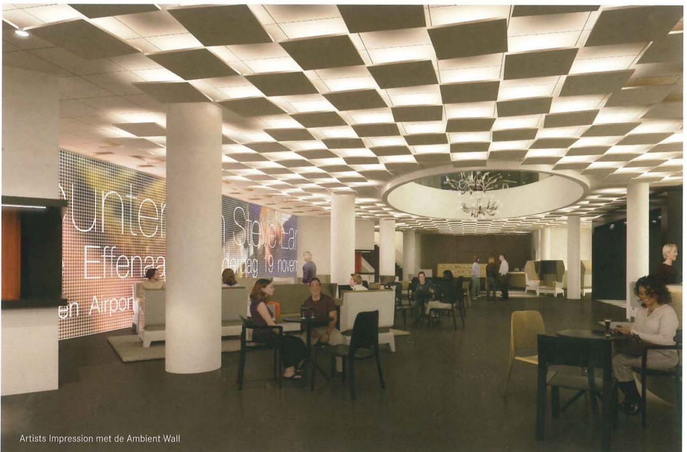
Artists Impression met de Ambient Wall