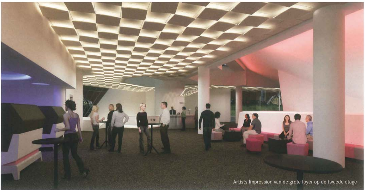
Artists Impression van de grote foyer op de tweede etage

“Je kunt wel weer witte kopjes nemen met het logo erop, maar je kunt er ook iets bijzonders van maken”