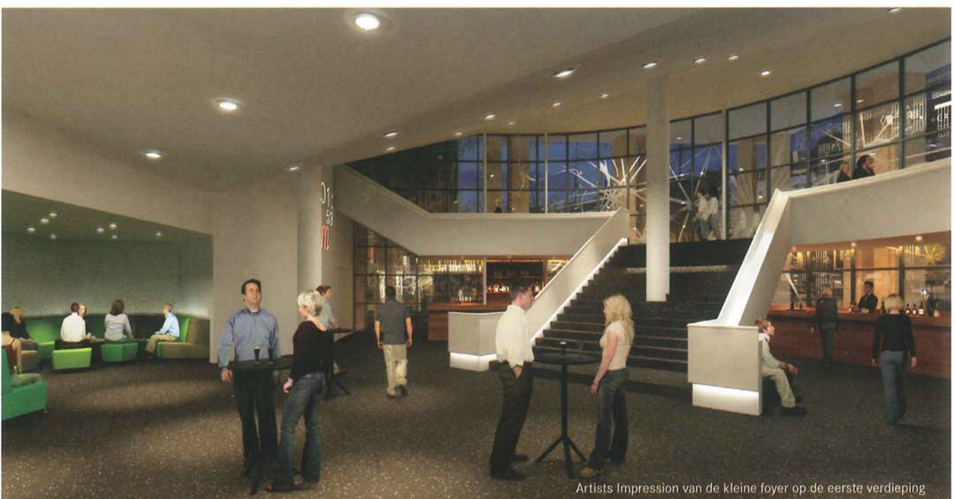
Artists Impression van de kleine foyer op de eerste verdieping