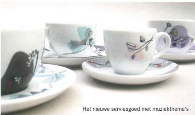
Het nieuwe serviesgoed met muziekthema's

“Je kunt wel weer witte kopjes nemen met het logo erop, maar je kunt er ook iets bijzonders van maken”