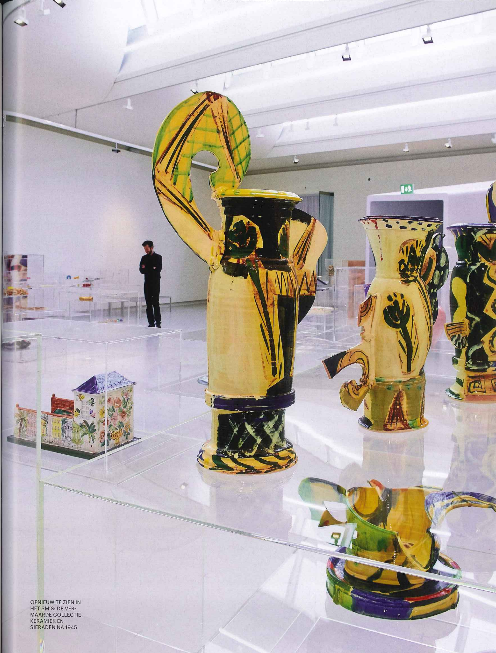
OPNIEUW TE ZIEN IN HET SM'S: DE VERMAARDE COLLECTIE KERAMIEK EN SIERADEN NA 1945.